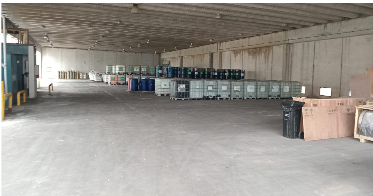
Tinglado de Sal de Aminas (arriba) y Tinglado ATR (abajo)