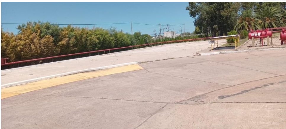
Playa de camiones