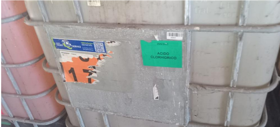
Tambores y bins almacenados