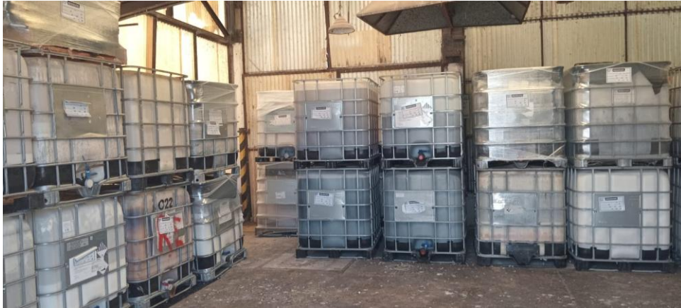
Depósito de residuos especiales