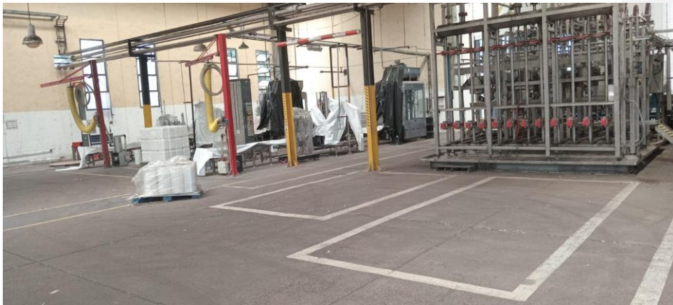
Zona de envasado