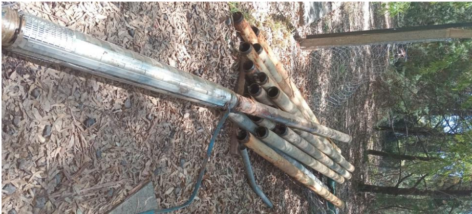
Trabajos en pozo N°8