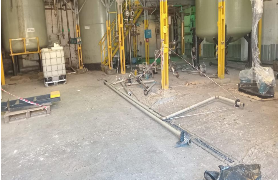
Zona de producción de aminas