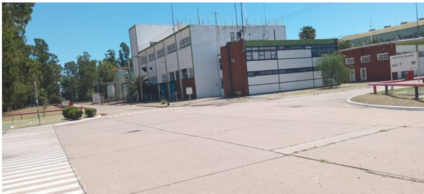
Vistas de planta sin personal para actividad productiva

Ministerio de Ambiente Calle 12 y 53 Torre 2, Piso 14 Buenos Aires, La Plata Tel. 429 - 5579 ambiente.gba.gob.ar