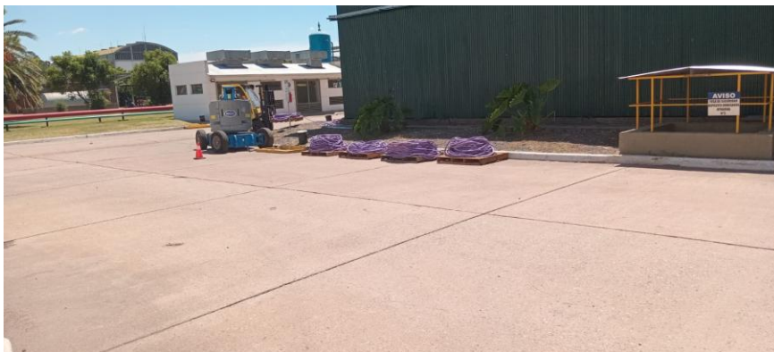
Desarmados de Equipos y cables