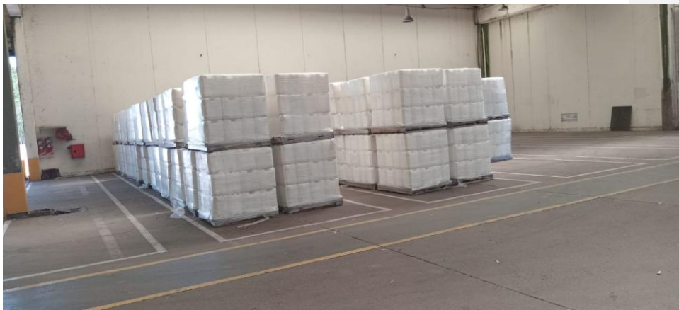
Bodones de 20 litros sin usar