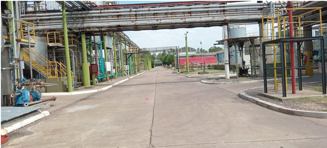
Vista de planta