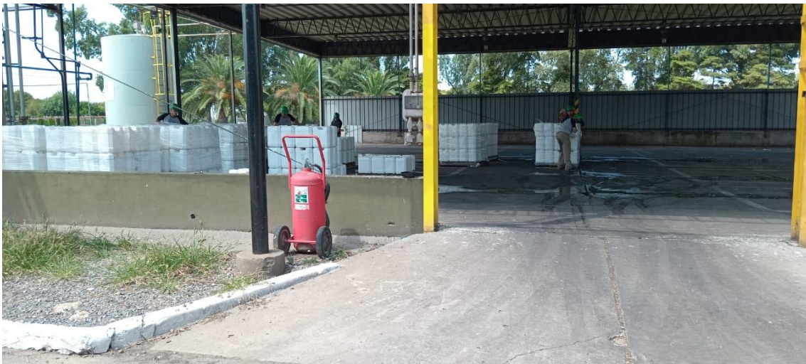
Limpieza de bidones