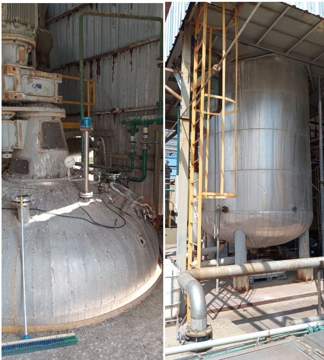
Vaciado y limpieza de Tanque R 20 de planta de atrazina