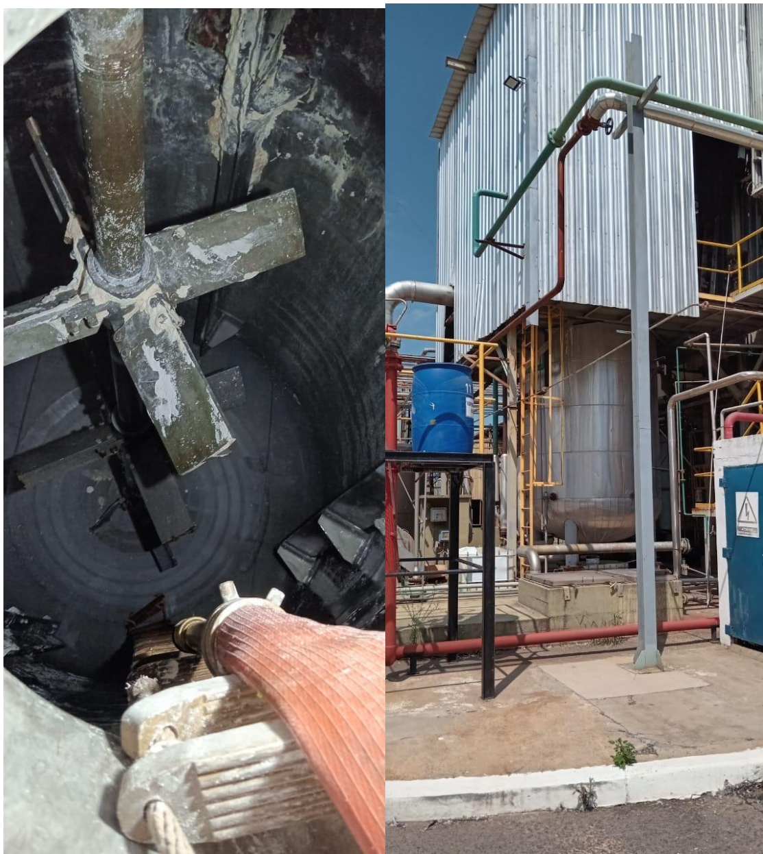
Vaciado y limpieza de Tanque R 20 de planta de atrazina

Ministerio de Ambiente Calle 12 y 53 Torre 2, Piso 14 Buenos Aires, La Plata Tel. 429 - 5579 ambiente.gba.gob.ar