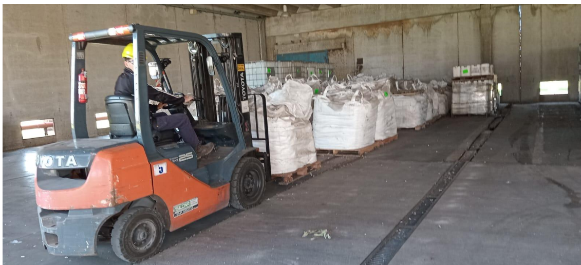
Carga de antrazina en camión